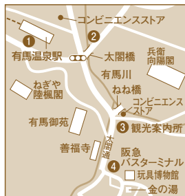
※乗降場所は、当日の交通状況により①～④のいずれかになります