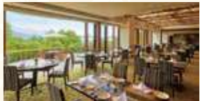
ハーヴェストクラブ蓼科「ラコルタ」

蓼科本館、蓼科リゾート、グラマラスダイニング蓼科などのレストランをご利用いただけます。