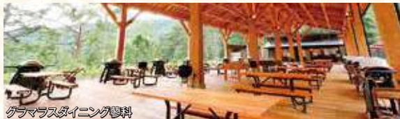
グラマラスダイニング蓼科