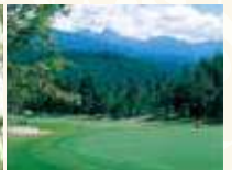
蓼科東急ゴルフコース