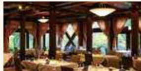
ハーヴェストクラブ蓼科リゾート「フレグラン」