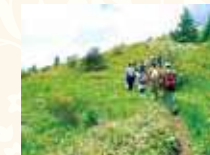
トレッキングコース

客室数:50室 ※総客室数55室(東急不動産所有分5室含む)／温泉スパリゾート(露天風呂付温泉大浴場、屋内温泉プール、マッサージコーナー、休憩コーナー、ショップ) ※タウン内のレストランをご利用ください ※東急リゾートタウン蓼科:蓼科東急ゴルフコース、蓼科東急スキー場 他