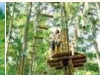
フォレストアドベンチャー