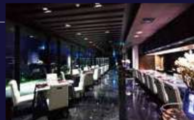
フレンチ「Côte & Ciel(コート・エ・シエル)」