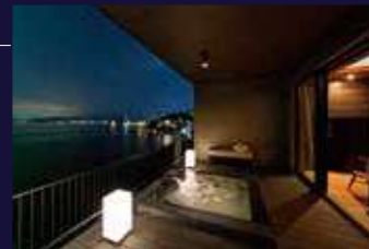
客室温泉露天風呂