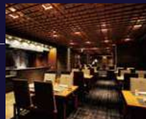
日本料理「菫(ぎ)らく」

緑越しに海を望む日本料理「菫らく」、食と眺めを手軽に楽しむbuffet「Oli-va(オリヴァ)」、東館最上階にあるフレンチ「Côte & Ciel(コート・エ・シエル)」と、気分に合わせて食事のスタイルを選べます。