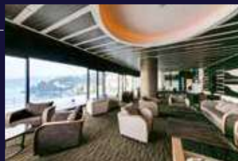
VIALA会員優先ラウンジ

クスノキに温かく迎えらるるエントランスを抜けると、落ち着いた落ち着いたロビーに、眺望テラスではゲストを包み込むように迎えてくれる海の眺めが広がります。